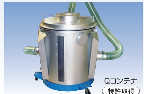
Qコンテナ 特許取得