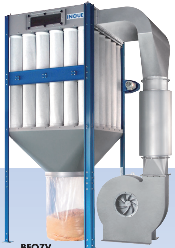
BFQ7V 電動シェーキング V型