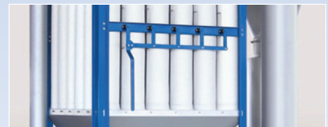
手動シェーキング S型