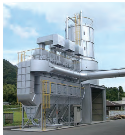
BFR5×6(22kW×3) トラック積載 LCA500