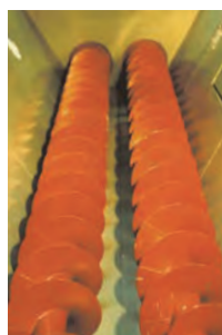
スクリーンコンベヤ